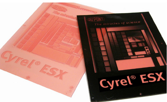
杜邦™ 赛丽® EASY ESX